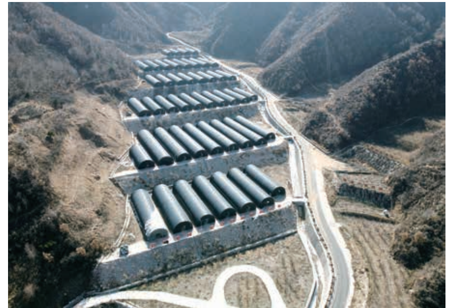
阜平縣駱駝灣村一處食用菌大棚

阜平是用烈士鮮血染紅的地方，駱駝灣村和顧家台村就有 13 個老八路。談起過去的崢嶸歲月，幹部群眾充滿自豪，一些上了年紀的老黨員、老村民更是情不自禁。今昔對比，大家有一個共同的認識：當年黨領導人民幹革命、建邊區、打日本鬼子，為的是咱中國人活得有尊嚴，讓老百姓當家做主人，沒有黨就沒有人民的翻身和解放；今天黨領導人民脫貧攻堅，派幹部、給資金、送科技、幫項目，承諾全面小康路上一個都不能少，為的是老百姓生活更幸福、活得更體面，同樣，沒有黨就沒有現在的好日子。