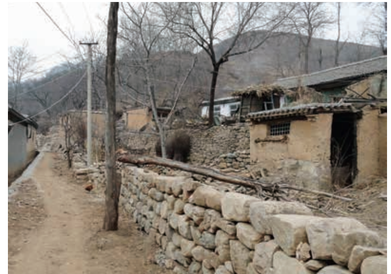
脫貧前的阜平縣顧家台村村貌