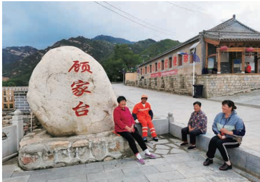
阜平縣顧家台村村民在村文化廣場一角交談