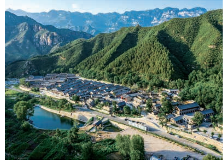
現在的阜平縣駱駝灣村村貌