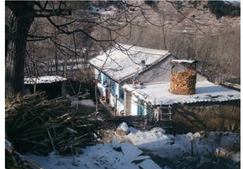
脫貧前的阜平縣駱駝灣村一處民居

道路寬了。過去，鄉村泥土路又窄又爛，收玉米、挖土豆上山下山全靠肩挑背扛，晴天一身汗，雨天一身泥。如今，鄉村路連通省幹道，也連通家家戶戶，泥土路變成水泥路，「小推