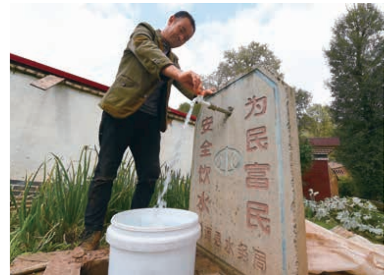
現在渭源縣元古堆村村民在自來水龍頭前接水