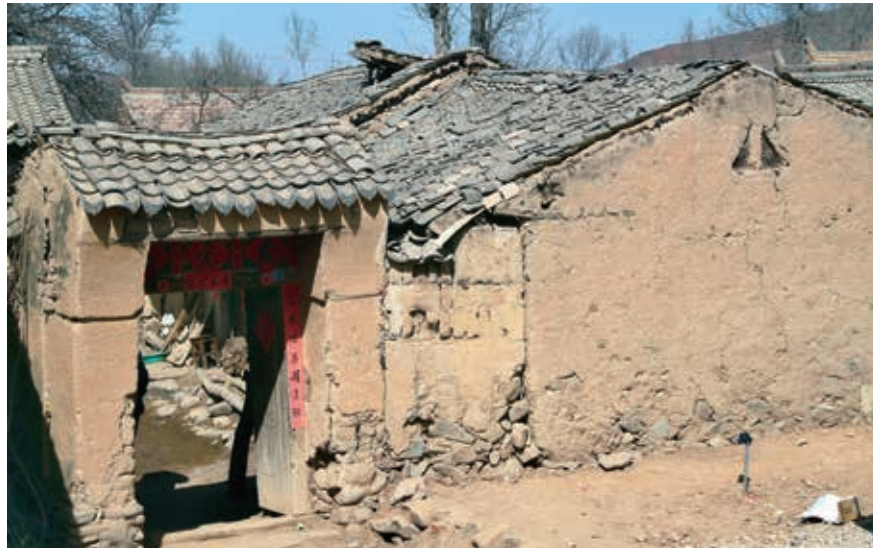
脫貧前的渭源縣元古堆村一處民居