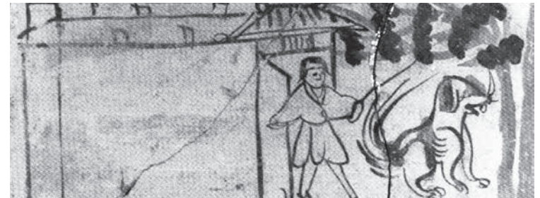
魏晉南北朝時期守衛圖畫像磚

西晉本着古代一夫一婦耕田百畝的遺意，承認男子佔有田地的限額為七十畝，女子三十畝。課租不問每戶佔田多少，按一丁交納租穀。丁男五十畝，收租四斛。即課田每畝定額交租八升，改變了屯田民按收成比例納租的方式。同時沿用曹魏之制，丁男之戶交納實物，稱為調。戶依資財貧富分為九等，調按戶等收