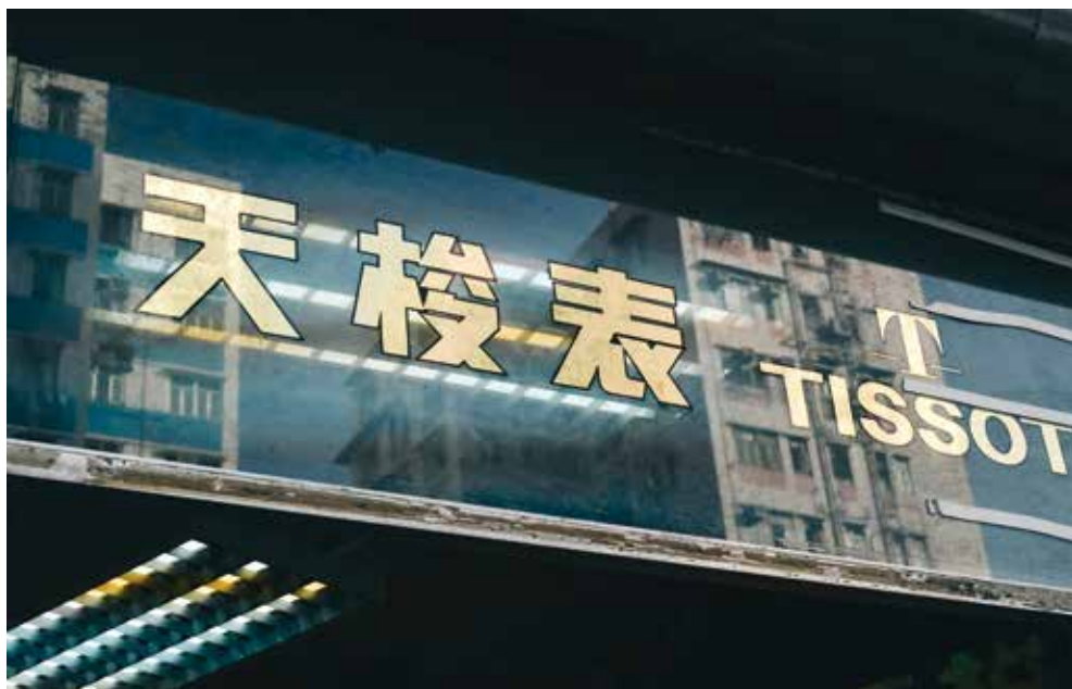
天梭錶的廣告詞是「時間，隨你掌控」；門外的舊區建築已幾番新。