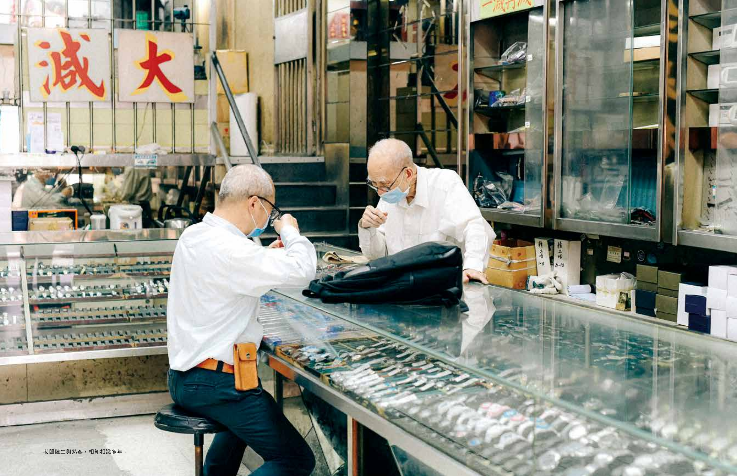
老闆陸生與熟客，相知相識多年。