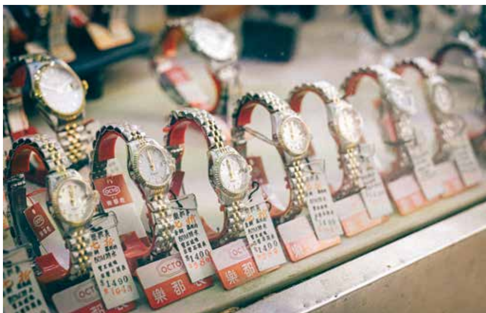
「遲唔會遲，早唔會早，戴錶戴樂都，樣樣有分數」，樂都錶在市場已近絕跡。