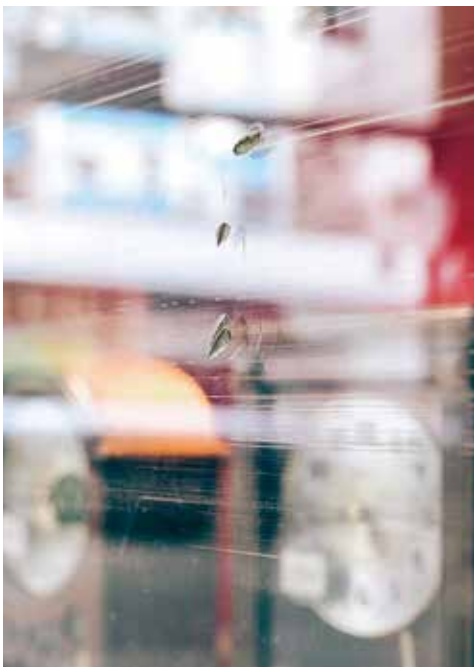
刀過留痕，櫥窗上留下被斧頭砍過的痕跡。