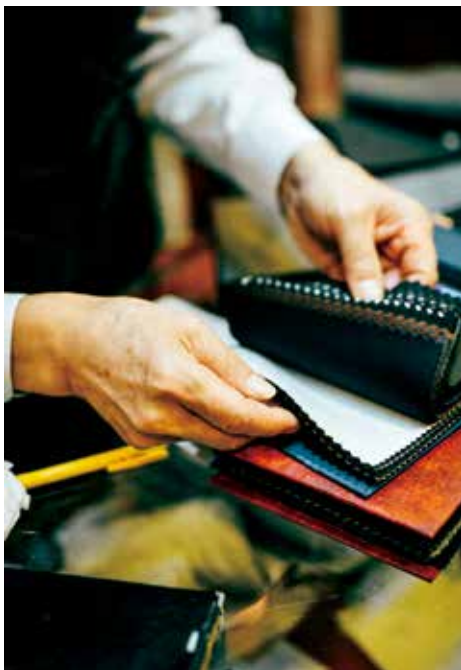
除了女裝旗袍，也造男裝長衫，使用上乘的意大利布料。