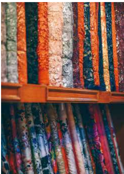
一匹匹花布，成了美華的花牆壁。