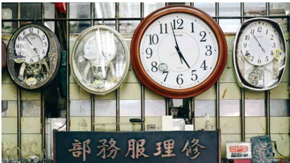
修理服務部的牆上，留有昔日的子彈洞，闖人不可內進。

經歷仍猶有餘悸，三名劫匪闖入店內，連轟五槍，企圖以斧頭打破櫥窗的防盜玻璃，在警鐘響起後落荒而逃。打劫也分秒必爭，奪走十多隻勞力士，匆忙間卻留下一個鐵錘。還有一次，他被偽裝客人的賊人用一把牛肉刀劈下來，險些命中要害，讓他「賣力變了賣命」。 遊絲亂、缺齒輪、斷擺尖，對於廣生表行的鐘錶匠人而言，機械鐘錶的各式維修駕輕就熟。表行現時還會為客人的手錶換電池、抹油或作小維修，但不少廠家已經倒閉或停產，舊鐘錶的零件一旦破損，或許已無法找到合適的替換。時移世易，鐘錶量產後，機械錶漸被價廉物美的電子錶，或是科技先進的智能手錶取代，人們習慣東西壞了只會丟棄換新。舊時人惜物，可以修復的都會修復，能夠惜物的人，也會惜人。感情是不斷的重修舊好，一生的修修補補。 時間向前邁進，店內數千件存貨卻似為表行倒數，當存貨賣得七七八八，就是表行光榮結業之時。萬物有時，日暮窮途，老店鋪的脈搏律動，終有一日停下節奏，雋永的是那份以時間為本業的一生鍾情。