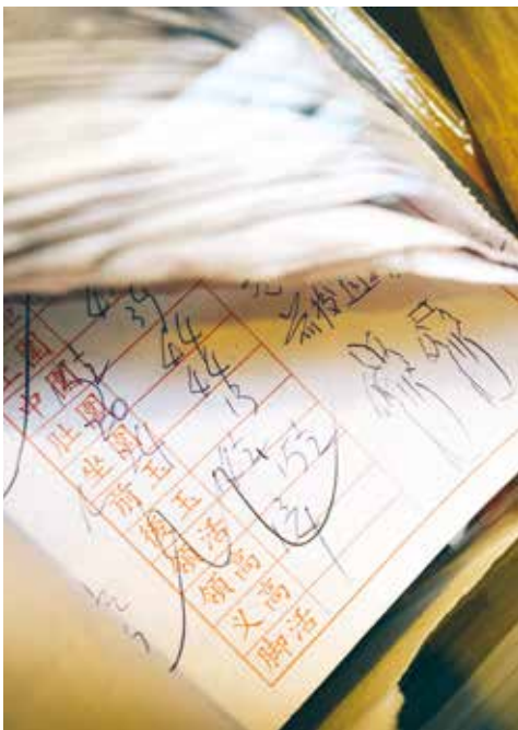
要造出一襲合身的旗袍，需要精準量度客人身材尺寸。