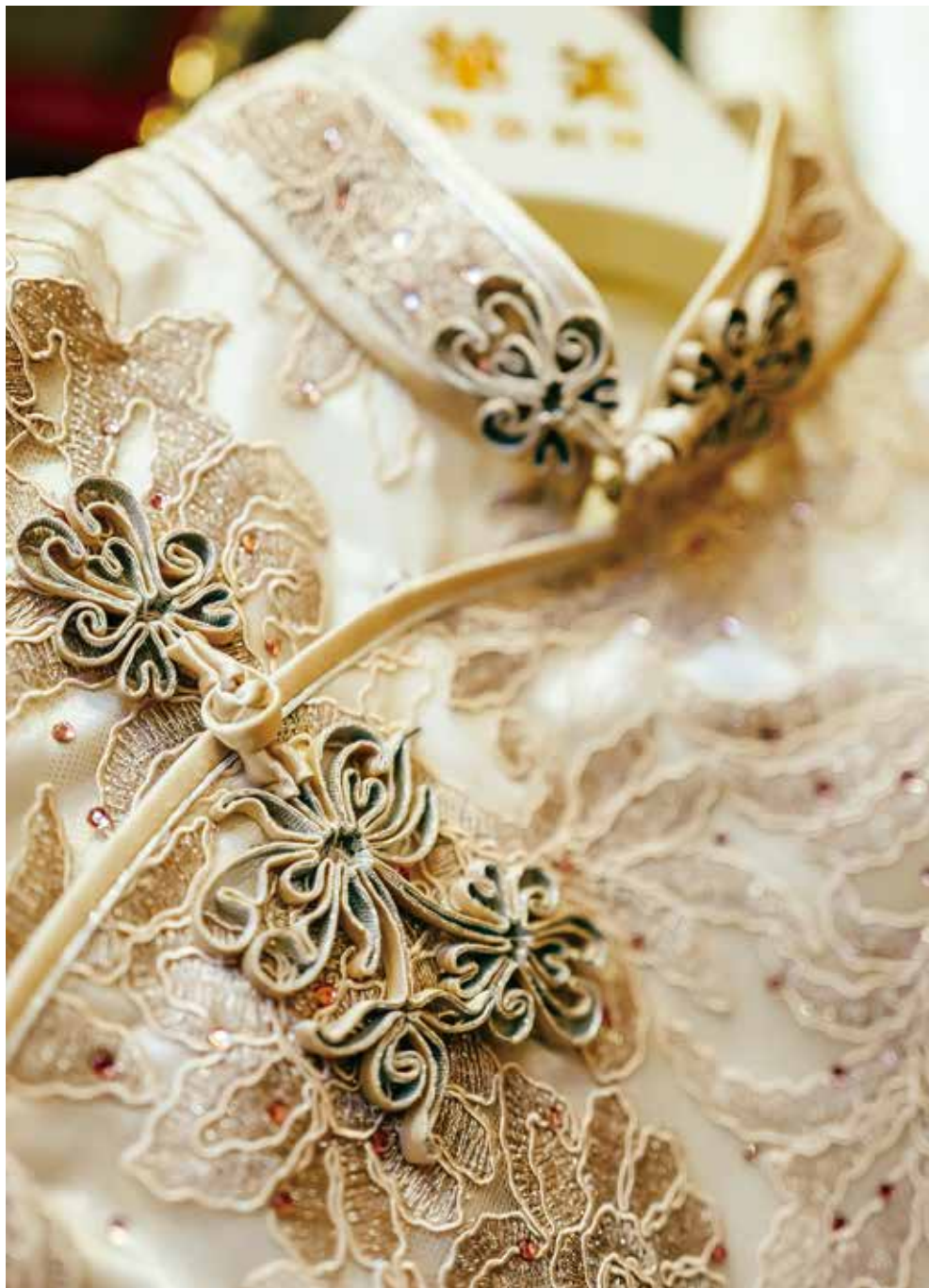
花鈕是傳統中式盤扣手工藝，款式百變，上好的旗袍花鈕顏色與緞邊的布相同。