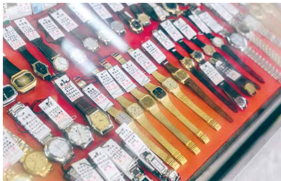
時不我與，昔日的名廠錶，成為今日的特價錶。