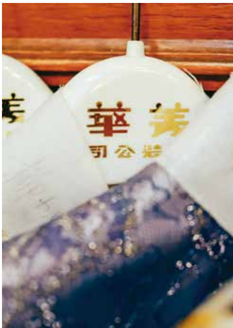
一列衣架上印有美華時裝的金漆招牌。