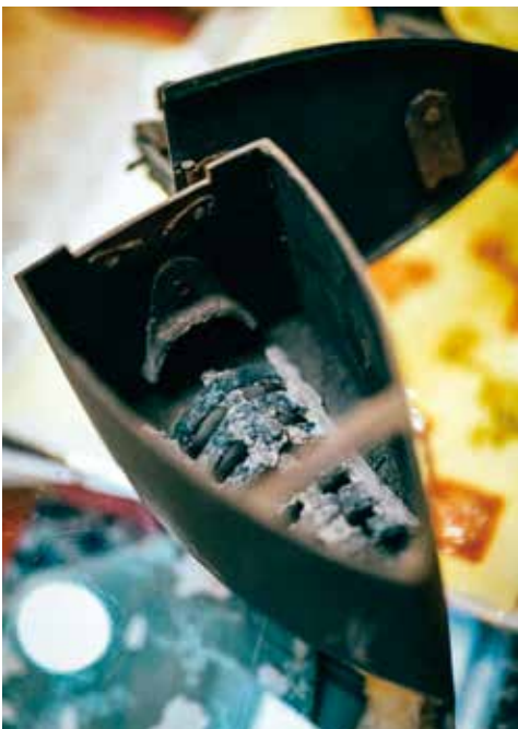
簡師傅祖母所用的鑄鐵炭火燙斗。燙貼順滑的長衫，少不了熨燙功夫。