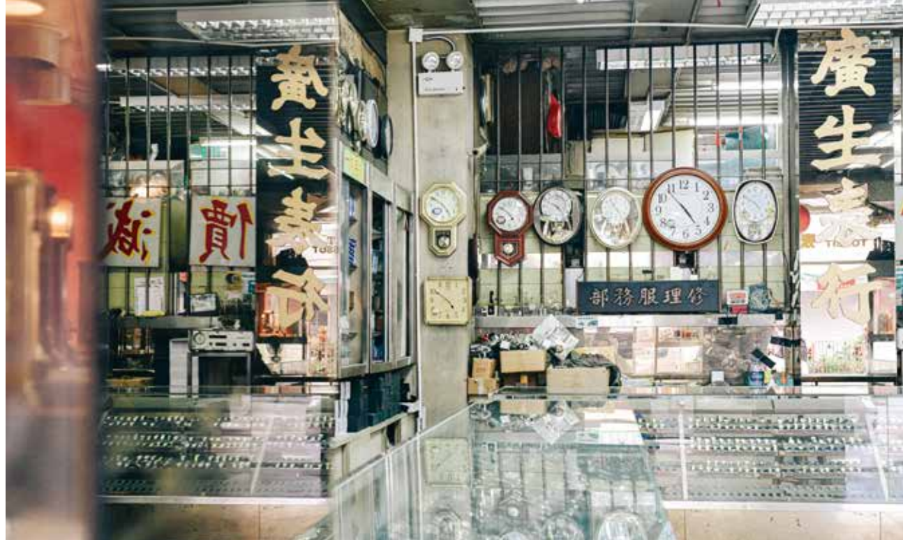
寬敞的店內除了一個個玻璃櫥櫃，牆上也有一列鏡子，增加通透空間感。

石數目可達十數粒的貴價幼馬錶，造工精細；行針石英錶於六十年代末成功研製，機芯零件較少，以電池為動力，利用石英震盪原理計時，準繩度高，每年偏差不過兩秒，但會隨年月損耗；電子跳字錶在七十年代風靡市場，美國剛登陸月球後，太空科技應用於工業生產，二極發光管和液晶體顯示電子錶先後研發成功，價廉物美，為成錶工業帶來大革命。 撫今追昔，香港的鐘錶業以維修作為起點，到配件生產，至成錶組裝，在時代巨輪上不斷精益求精。 在二十世紀初，手錶珍貴，若有損壞也不隨意丟棄，人們需要維修及更換零件，鐘錶修理服務業應運而生，師傅多是從事機械或五金出身；在三十年代，香港已有山寨錶帶廠及錶殼廠，以家庭式經營，製造配件予手錶維修之用；戰時鐘錶業一度停頓，僅餘少數二手鐘錶買賣；至戰後鐘錶配件生產商業復甦，受益於大量內地移民來港，帶來充裕的勞動力，鐘錶業乘時崛起，轉口貿易活躍，不少人循學師