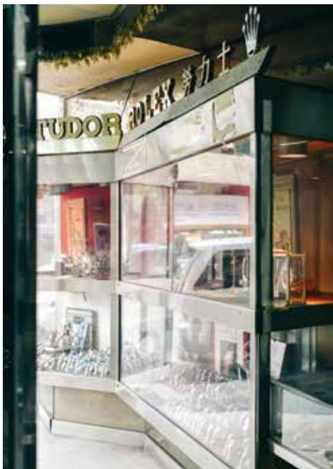
勞力士、帝舵表，同屬一家手錶母公司的兄弟品牌，各自各精彩。