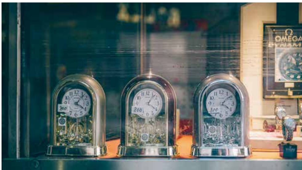
除了腕錶，亦售各式旋轉時鐘。

經歷仍猶有餘悸，三名劫匪闖入店內，連轟五槍，企圖以斧頭打破櫥窗的防盜玻璃，在警鐘響起後落荒而逃。打劫也分秒必爭，奪走十多隻勞力士，匆忙間卻留下一個鐵錘。還有一次，他被偽裝客人的賊人用一把牛肉刀劈下來，險些命中要害，讓他「賣力變了賣命」。 遊絲亂、缺齒輪、斷擺尖，對於廣生表行的鐘錶匠人而言，機械鐘錶的各式維修駕輕就熟。表行現時還會為客人的手錶換電池、抹油或作小維修，但不少廠家已經倒閉或停產，舊鐘錶的零件一旦破損，或許已無法找到合適的替換。時移世易，鐘錶量產後，機械錶漸被價廉物美的電子錶，或是科技先進的智能手錶取代，人們習慣東西壞了只會丟棄換新。舊時人惜物，可以修復的都會修復，能夠惜物的人，也會惜人。感情是不斷的重修舊好，一生的修修補補。 時間向前邁進，店內數千件存貨卻似為表行倒數，當存貨賣得七七八八，就是表行光榮結業之時。萬物有時，日暮窮途，老店鋪的脈搏律動，終有一日停下節奏，雋永的是那份以時間為本業的一生鍾情。