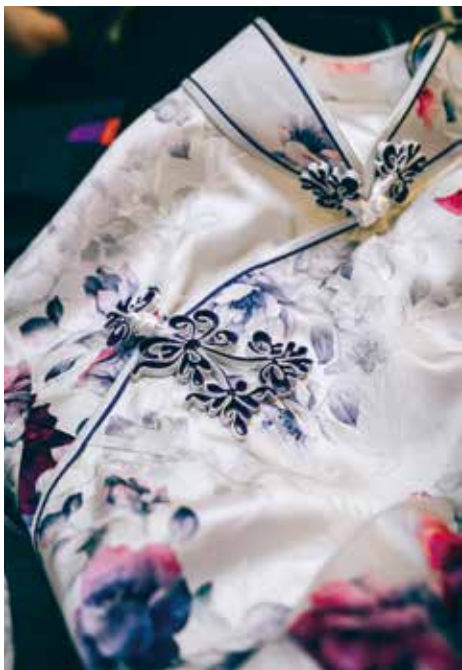
一粒襟前花鈕，製作時間也不少。