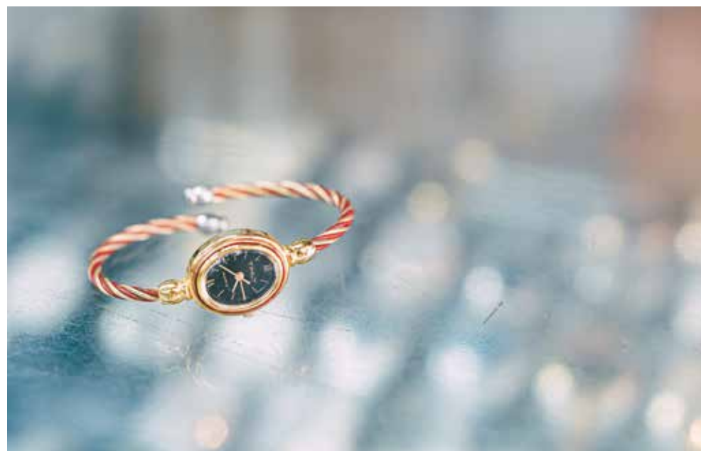
購自店內的七十年代上鍊錶，已停止行走，可到廣生換電池。