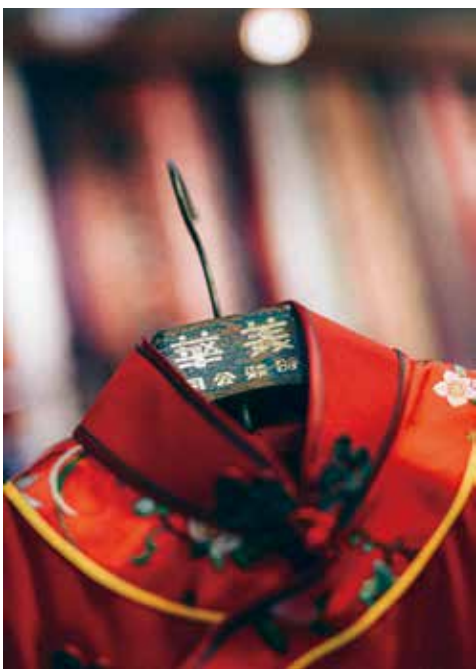
舊款的美華木衣架，見證店內悠久歷史。