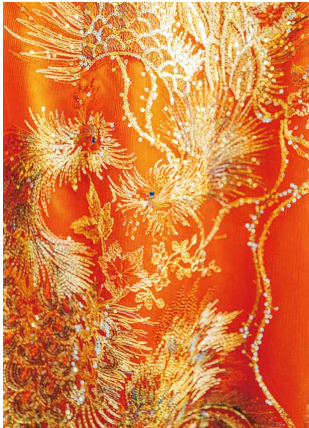
旗袍以金、銀線繡上不同的圖案，如龍鳳，牡丹，孔雀等圖案，寓意吉祥。