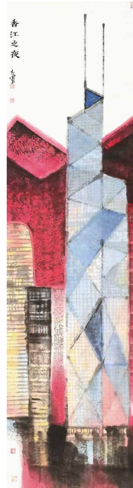
香江之夜 水墨設色紙本 180x48cm 2020