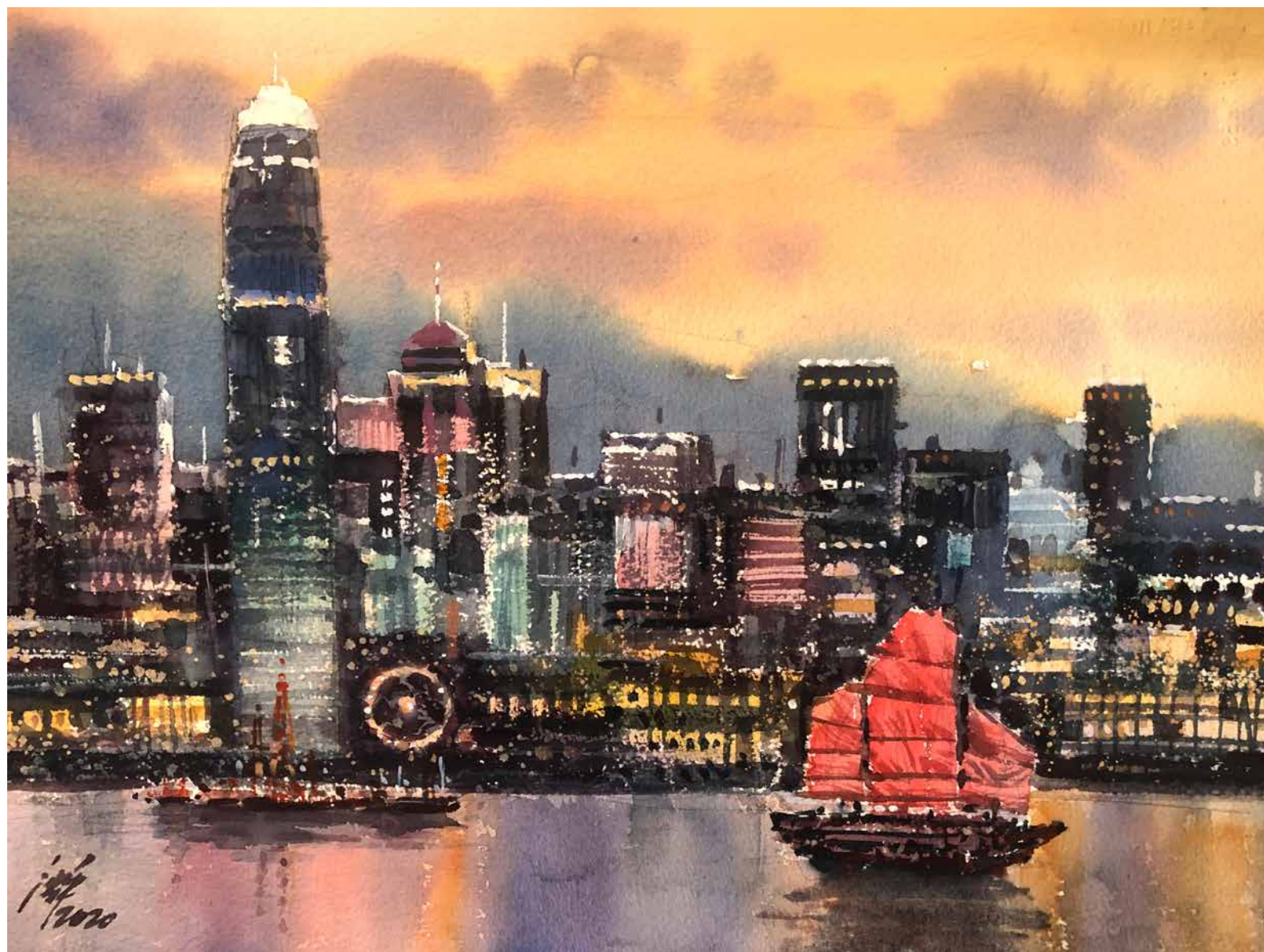
維港之夜 水彩紙本 28x38cm 2020