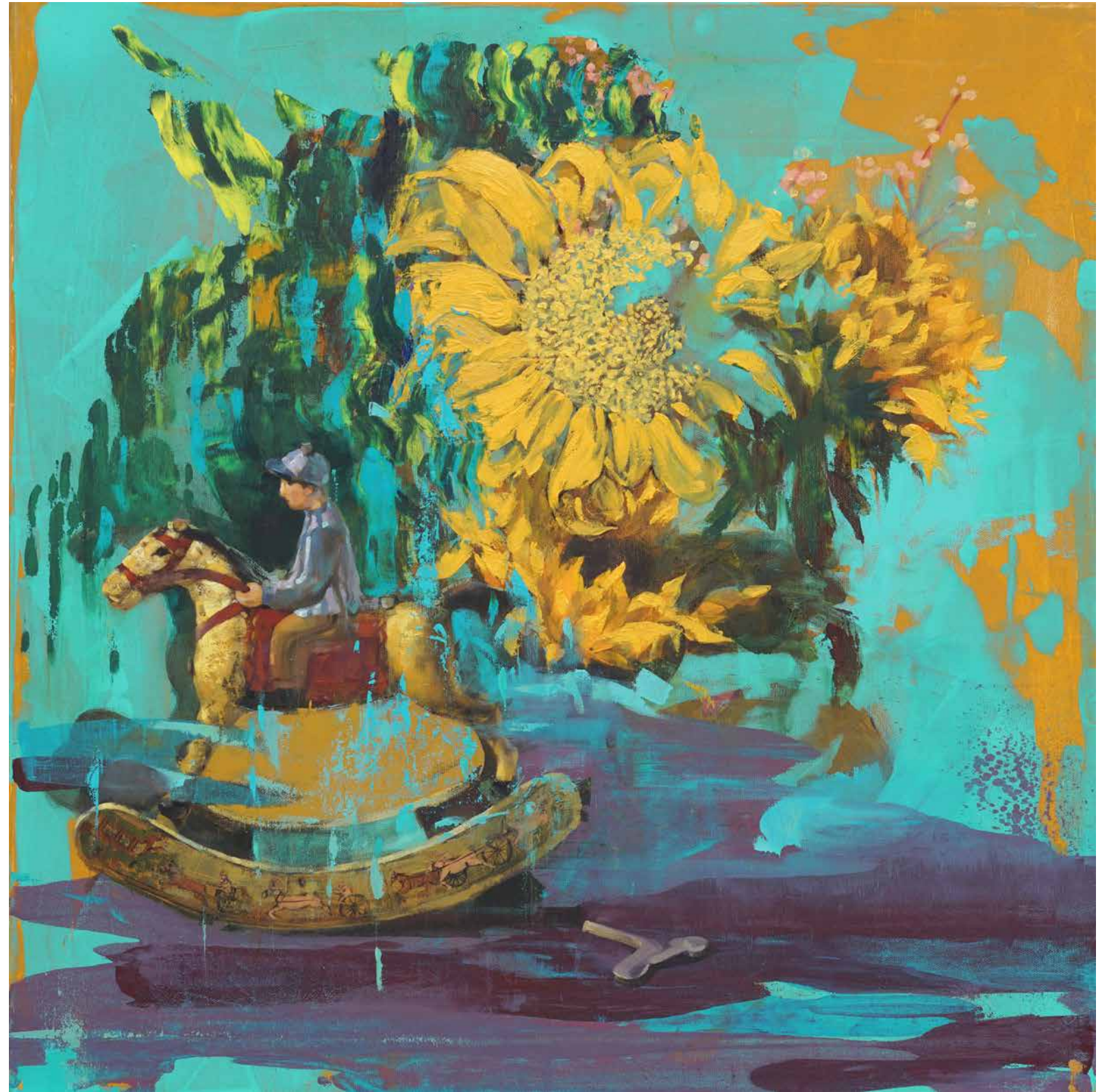
往日時光 油彩布本 61x61cm 2020