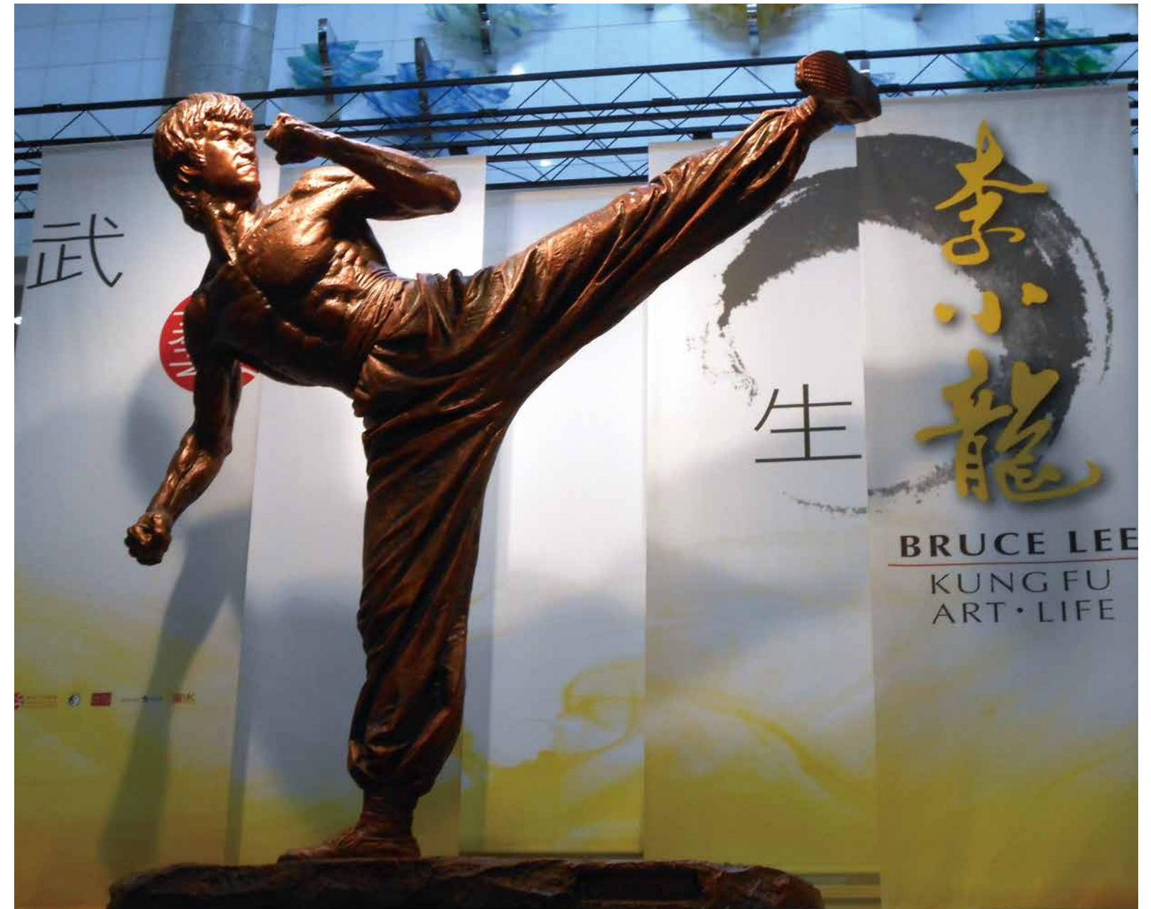
李小龍－疾惡如仇 銅雕塑 350 (H) cm 2013 安放於香港文化博物館