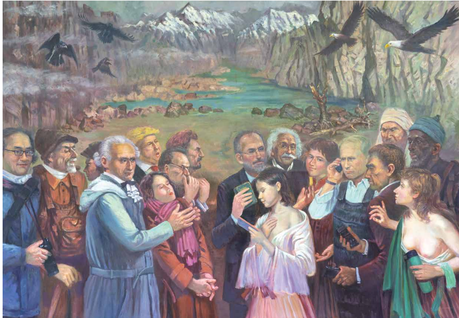
歲月艱難 油彩布本 120x165cm 2020