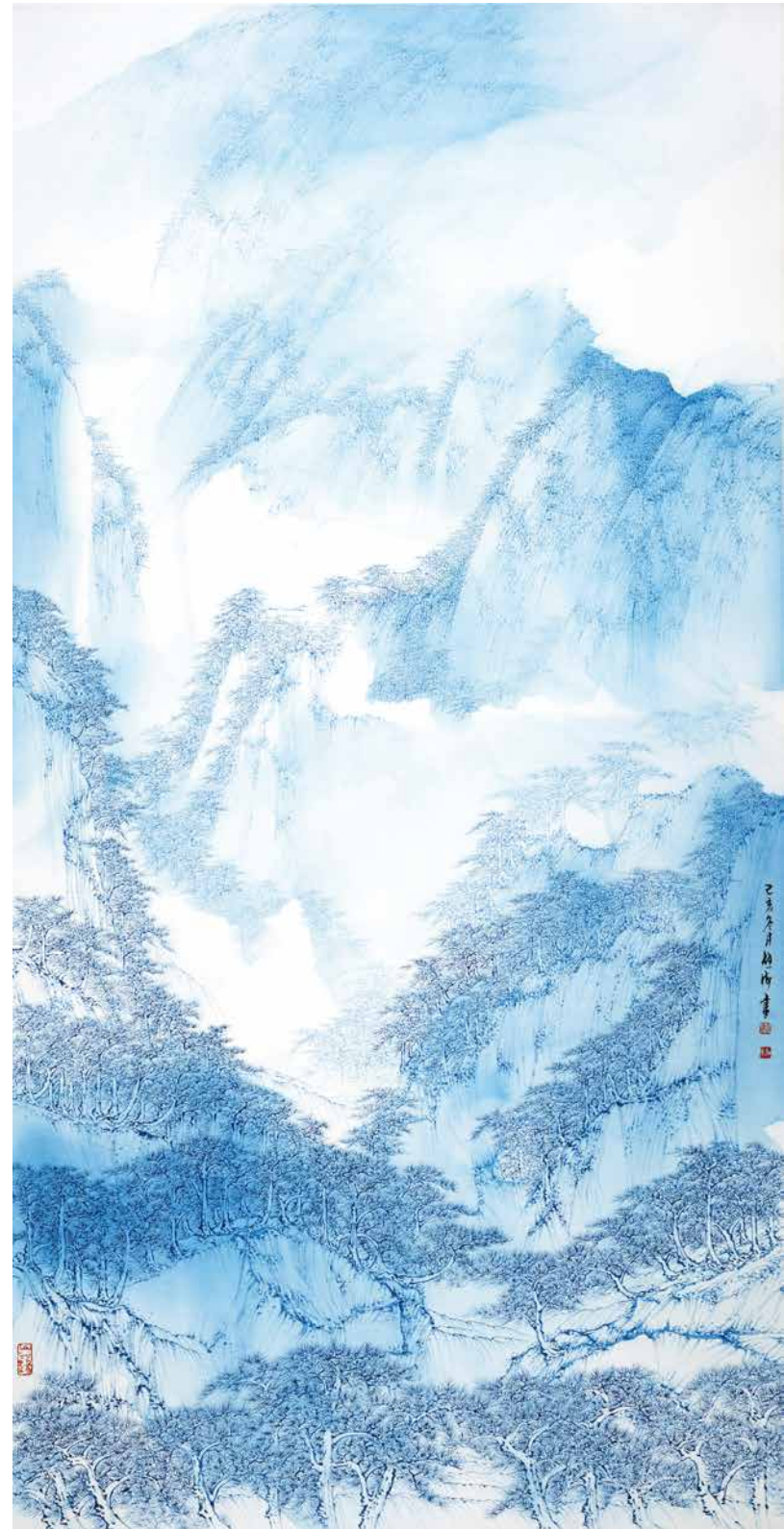
黄山云湧 設色紙本 137x69cm 2019