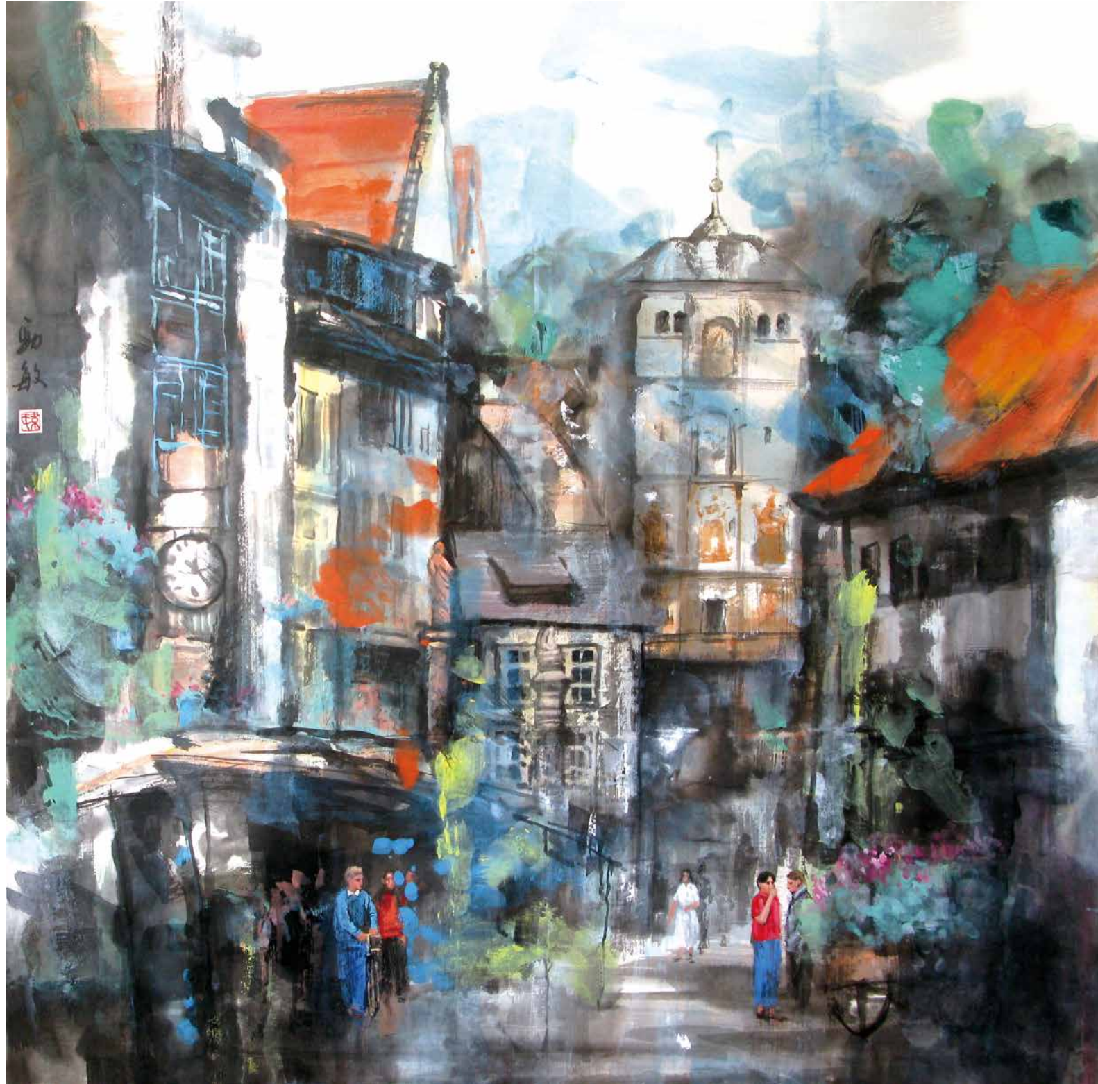
歐洲小景 水墨設色紙本 69x69cm 2013