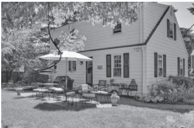
圖 1.2 美國人的住房外部