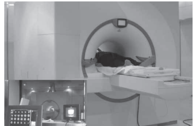
圖 1.4 中國科學院生物物理研究所認知科學重點實驗室的 3T 磁共振成像系統

在大的醫院裏都有磁共振成像（MRI）的檢查，如果懷疑某人頭腦裏有瘤子，通過磁共振成像可以檢查出來。但這種檢查只能把大腦的靜態結構反映出來，與心理活動相關聯的大腦活動無法顯現。功能磁共振成像（fMRI）配備了強大的計算機軟件可以把與心理活動相關聯的大腦活動顯現出來。