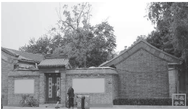
圖 1.3 中國人的住房外部

關係決定了這兩種文化中不同的自我觀或自我結構：美國文化中一個人的自我是獨立的、孤立的，而中國文化中一個人的自我依賴於他人。