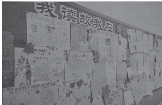
圖 1.5 「我讀故我在」（北京晚報，2015，4，1）