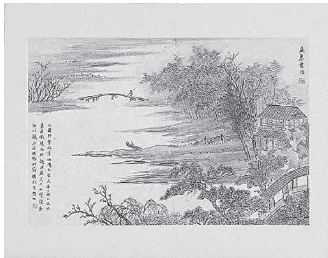
| [清] 吳穀祥《萬卷書樓》