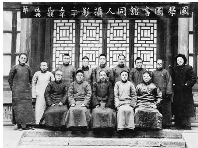
柳詒徵（前排居中者）等國學圖書館同人合影