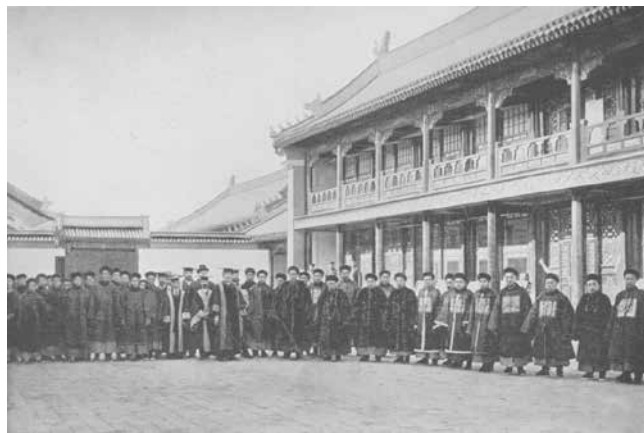
1902年京師大學堂教師在藏書樓前合影

更大的民族災難「庚子之變」，讓國家付出了沉重的代價，也幾使清朝統治集團陷入滅頂之災。這種形勢直接催生了「清末新政」，興辦圖書館就是新政的重要內容。至宣統二年（1910）《京師圖書館及各省圖書館