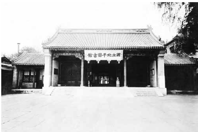
| 1928 年的國立北平圖書館（前身為京師圖書館）