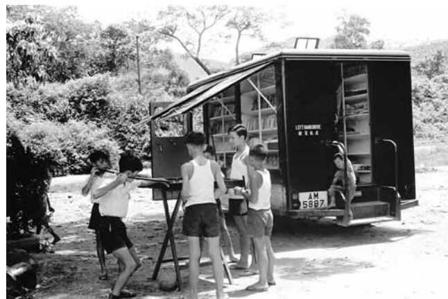
| 20 世紀 60 年代，香港新界大埔社會福利署流動圖書館