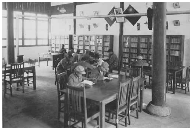
20 世紀 30 年代的安徽省立圖書館中學生閱覽室

「文革」結束後，圖書館事業進入復甦和繁榮的新時期，出現了欣欣向榮的局面。與此同時，卻又受到市場經濟大潮的無情衝擊，致使經營創收、「以文養文」等種種弊端一時成為風氣。於是「有償服務」盛行，各種收費和變相收費成了圖書館的重要經濟來源，還為讀者設立了形形色色不平等的門檻。這一時期，館舍設備條件的極大改善和辦館方針上的亂象叢生，形成了鮮明