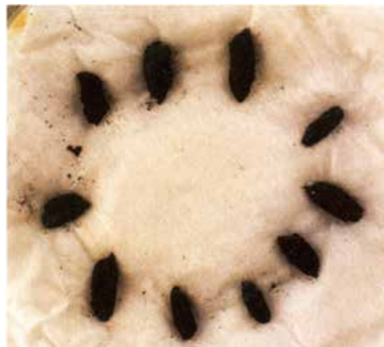
河姆渡遺址發現的水稻。 代表了南方的水稻文化。

1960年代末，美國芝加哥大學的華裔學者何炳棣，在他的著作《黃土與中國農業的起源》中，以大量無可辯駁的事實證明，中國農業的起源，具有自己的區域性和獨立性，並不是從兩河流域傳入的。這一結論，一再為考古發現及新的研究成果所證實。後來他在回憶錄《讀史閱世六十年》中提及此事，寫道：「我曾嚴肅地