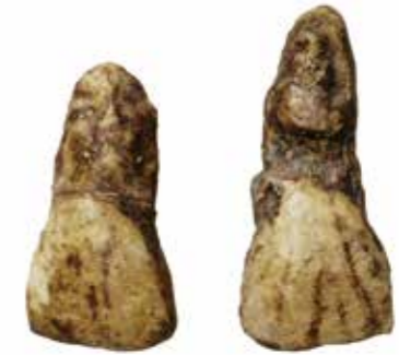
元謀人上門齒。元謀人具有從纖細型南方古猿向直立人過渡的特點。