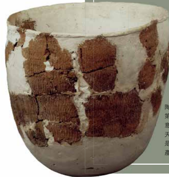
陶罐。陶器是人類第一次按照自己的意志創造出來的非天然物質的物品，是人類定居生活的產物。