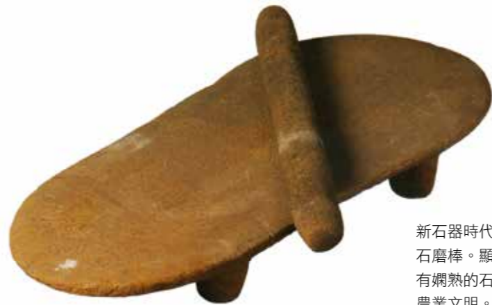
新石器時代裴李崗文化石磨盤、石磨棒。顯示中原地區的先民已有嫺熟的石器加工技巧和發達的農業文明。

2000年出版的《稻作、陶器和都市的起源》（嚴文明、安田喜憲主編）一書指出：新石器時代早期，先民對稻穀種子反覆選擇，改變了野生稻的生存條件和遺傳習性，初步馴化成功，基本形成原始栽培稻。中國是亞洲栽培稻起源地之一，它與另一個亞洲栽培稻起源地——以印度為中心的南亞，是兩個各自獨立起源和演化的系統。