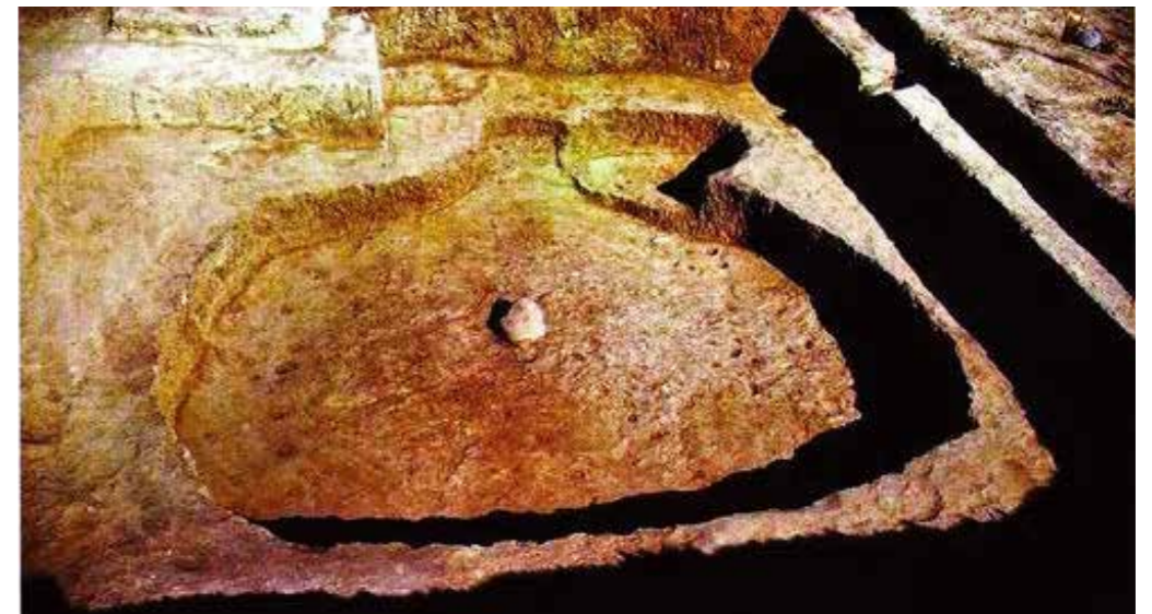
磁山文化遺址糧食堆積層。代表了北方旱作農業的穀子文化。

1976年至2011年，考古工作者在河北武安磁山新石器文化遺址，發掘灰坑468個，其中88個長方形窖穴底部有糧食堆積，層厚為0.1公尺至2公尺，數量之多，堆積之厚，極為罕見。中國科學院地質與地球物理研究所進行科學鑑定後認為，磁山遺址不僅是世界粟的發祥地，也是黍的起源地，中國黃河流域黍的栽培歷史有可能追溯至一萬年前。